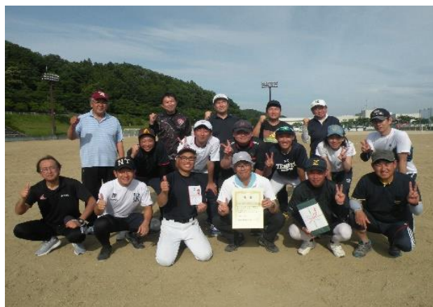
(優勝した学校長会・教頭会・教職員チーム)